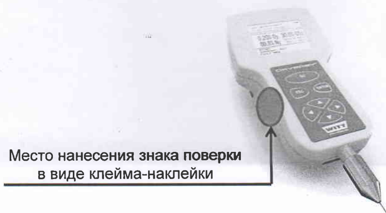
Рисунок А.1.- Схема пломбировки газоанализаторов

Схема пломбировки газоанализаторов от несанкционированного доступа с указанием места нанесения знака поверки в виде клейма-наклейки приведена на рисунке А.1.